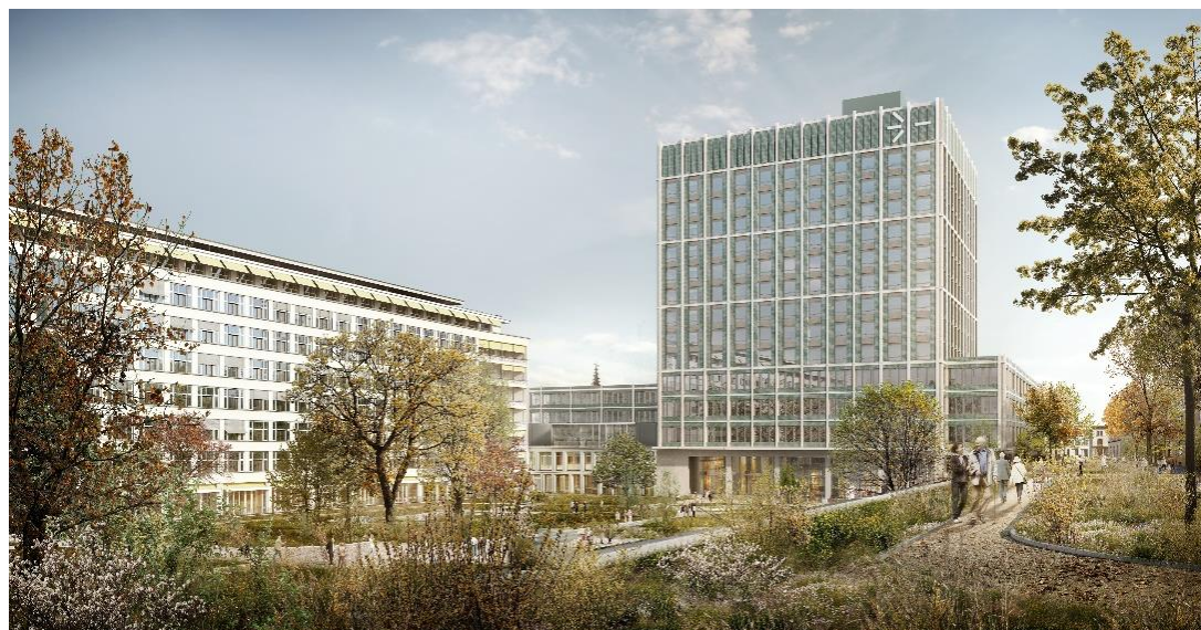
Blick aus dem Spitalgarten zum zukünftigen Klinikum 2 (Richtung Petersgraben) und zum bestehenden Klinikum 1 (links, Richtung Spitalstrasse).

Das Areal des Universitätsspitals Basel (USB) ist in Bewegung. Was lange ein Projekt in Form von Daten, Modellen und Plänen war, wird nun sichtbare Realität: Der Neubau von Klinikum 2 am Petersgraben hat begonnen.